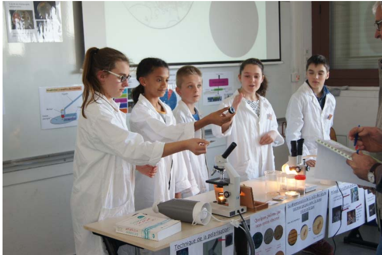
« D'où vient la poussière ? » Collège de l'Anglée Ste Hermine (85)