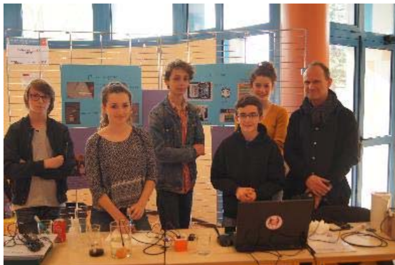
« Les poissons ont un coup de chaud ! » Collège Petite Lande de Rezé (44)