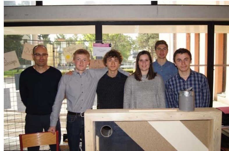
« Capteur solaire à air » Lycée Perseigne Mamers (72)