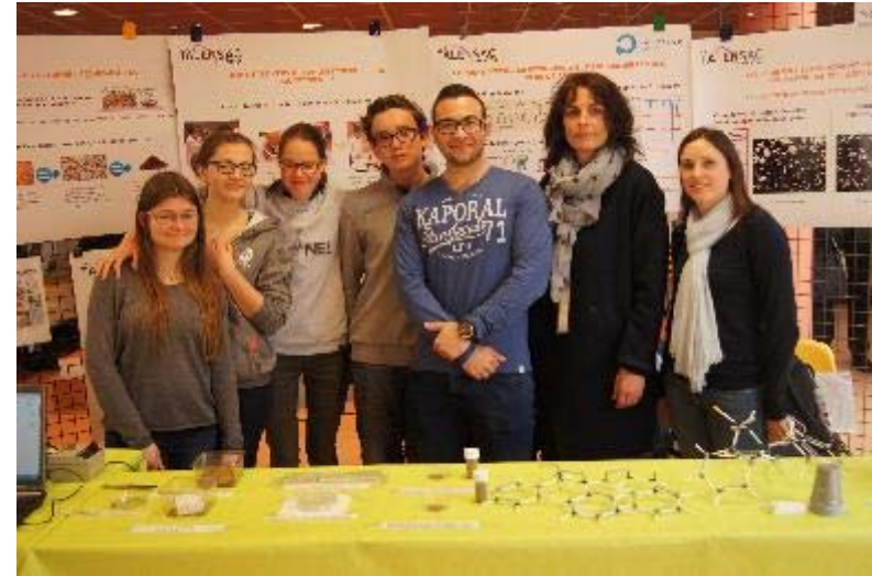
« Une poubelle écologique : comment les vers peuvent-ils dégrader le polystyrène ? » Lycée Talensac de Nantes (44)