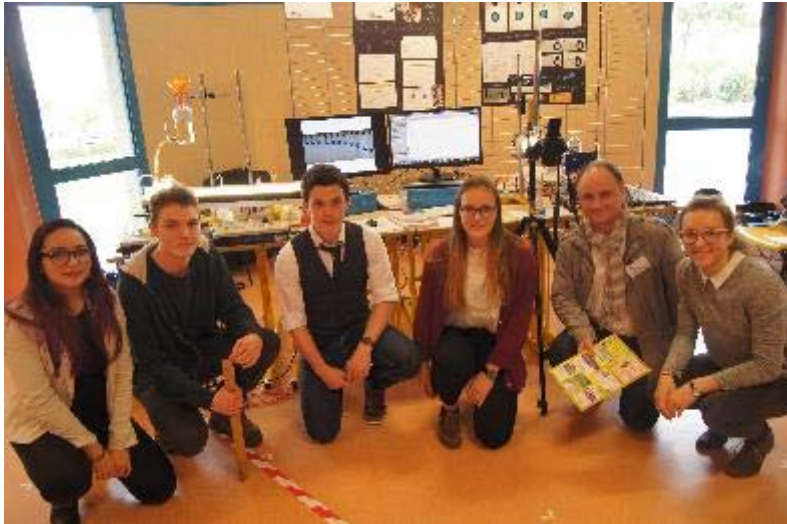
« Que peut nous apprendre une goutte de fluide ? » Lycée Douanier Rousseau de Laval (53)