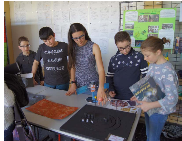
« Au fait c'est quoi un satellite ? » Collège Alfred Jarry Renazé (53)