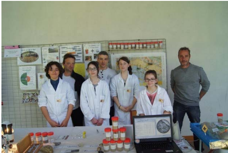
« Pourquoi les grains de sable ne sont-ils pas tous les mêmes » Collège de l'Anglée Ste Hermine (85)