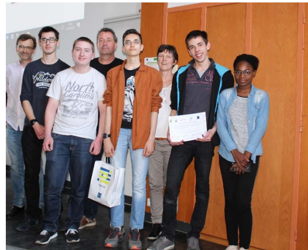
« Sciences et Thérémine » Lycée Chevrollier Angers (49)