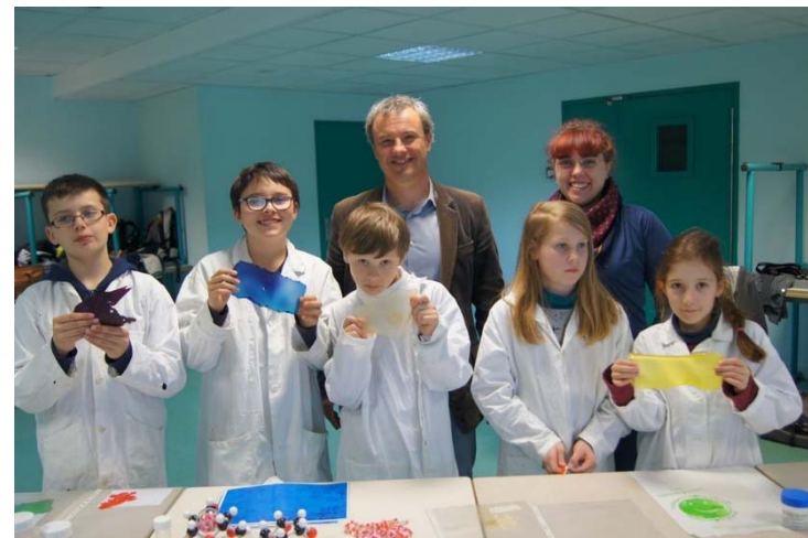
« L'eau de cuisson du riz : un déchet valorisable ? » Collège St Stanislas Nantes (44)